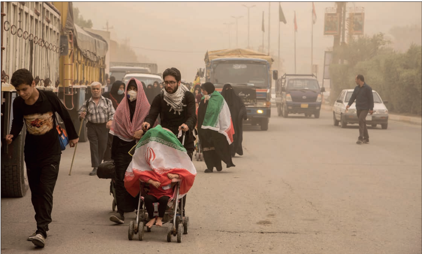
زائران با وجود گرد و غبار در راه زیارت کربلا هستند.