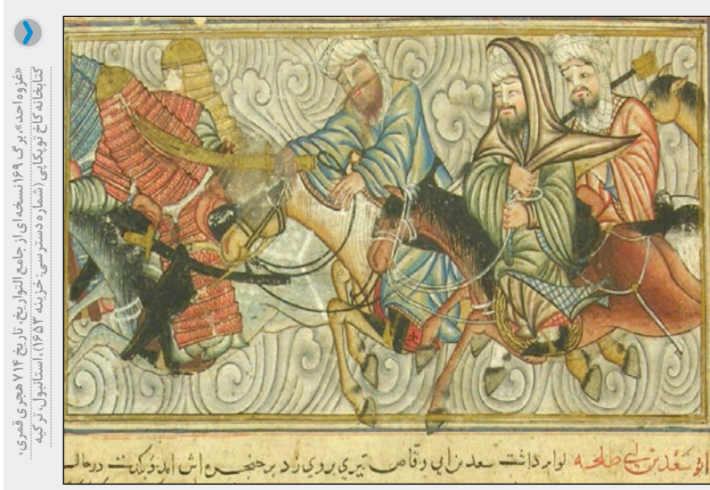
فرهنگ‌نامه، برگی از کتاب «جامع التواریخ» تاریخ ۱۳۹۶ هجری قمری، کتابخانه کاخ توپکاپی، شماره ۱۳۵۳، استانبول، ترکیه.