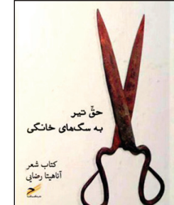
حق صر به گمشدگان خانگی کتاب شعر انوار رضایی

در این پاره آغازین شعر «حرارت در حاشیه» راوی با گفتن از ماه و اسد، به واقع‌الشاره می‌کند که برای اکثر خوانندگان آشناست. مرگی آشنا که در وقت معینی از سال روی داده و همین اشاره کافی است تا از طریق غیاب حضور آن مرگ به استعاره مرکزی شعر تبدیل شود. در پاره نخست کتاب اما وضع به گونه دیگری است. هجوم