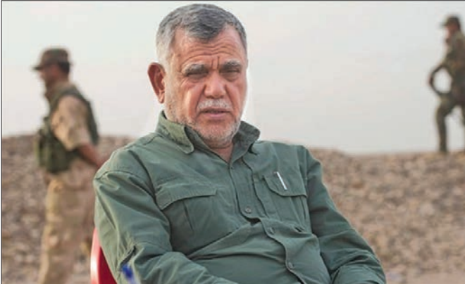
حکم نهایی در صورت بروز اختلاف میان عماری افزود: استناد اربیل به نقشه راهی که مرجعیت تعیین کرده، یعنی اعتقاد به اصل وحدت ارضی و پایبندی به قانون اساسی که به بسیاری از مشکلات پایان خواهد داد. دبیر کل سازمان بدر تأکید کرد، صحبت های برخی که از افراطی ها و حامیان کردها موضع گیری رسمی آنها محسوب نمی شود، به سه ویژه

جامعه فردا: با فرونشستن تب فراندوم و استعفا مسعود بازرانی و نیز بازپس گرفتن شهر استراتژیک کرکوک، پرچم عراق در حصیبه واقع در غرب استان الانبار، توسط نخست وزیر عراق برافراشته شده است. حیدر العبادی می گوید، دولت عراق آماده گفت و گو با کردها است و به نظر می رسد که کردها هم راضی به مذاکره هستند، اما یکی از اعضای اصلی حشد شعبی می گوید که برای مذاکره با کردها شرط داریم. به گزارش سایت موجز العراق، هادی العامری، دبیر کل سازمان بدر عراق و از رهبران نیروهای حشد شعبی در گفت و گو با رسانه های عراقی اظهار کرد، شرط بغداد لئو همه پرسنی استقلال و نتایج آن به دلیل تعارض با قانون اساسی کشور پیش از آغاز گفت و گو با اربیل است. مرجعیت دینی عراق نیز چهار شرط برای از سرگیری گفت و گوها با اربیل تعیین کرد که این شروط عبارتند از: باور وحدت ارضی و مردمی عراق، رد سیاست غیررسمی و غیرقانونی، پایبندی به قانون اساسی در همه گفت و گویی و مراجعه به رای دادگاه فدرال به عنوان تنها طرف دارای حق صدور